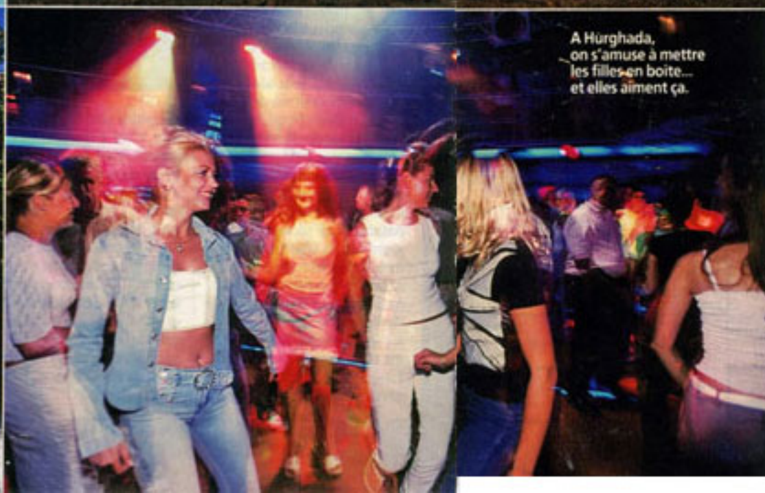
A Hurghada, on s'amuse à mettre les filles en boîte... et elles aiment ça.