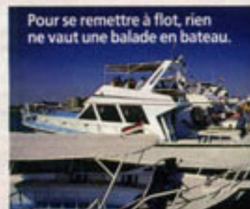
Pour se remettre à flot, rien ne vaut une balade en bateau.

Informations : office du tourisme d'Egypte, 90, avenue des Champs-Élysées, 75008 Paris. Tél. : 01.45.62.94.42. Ou www.egypte.com