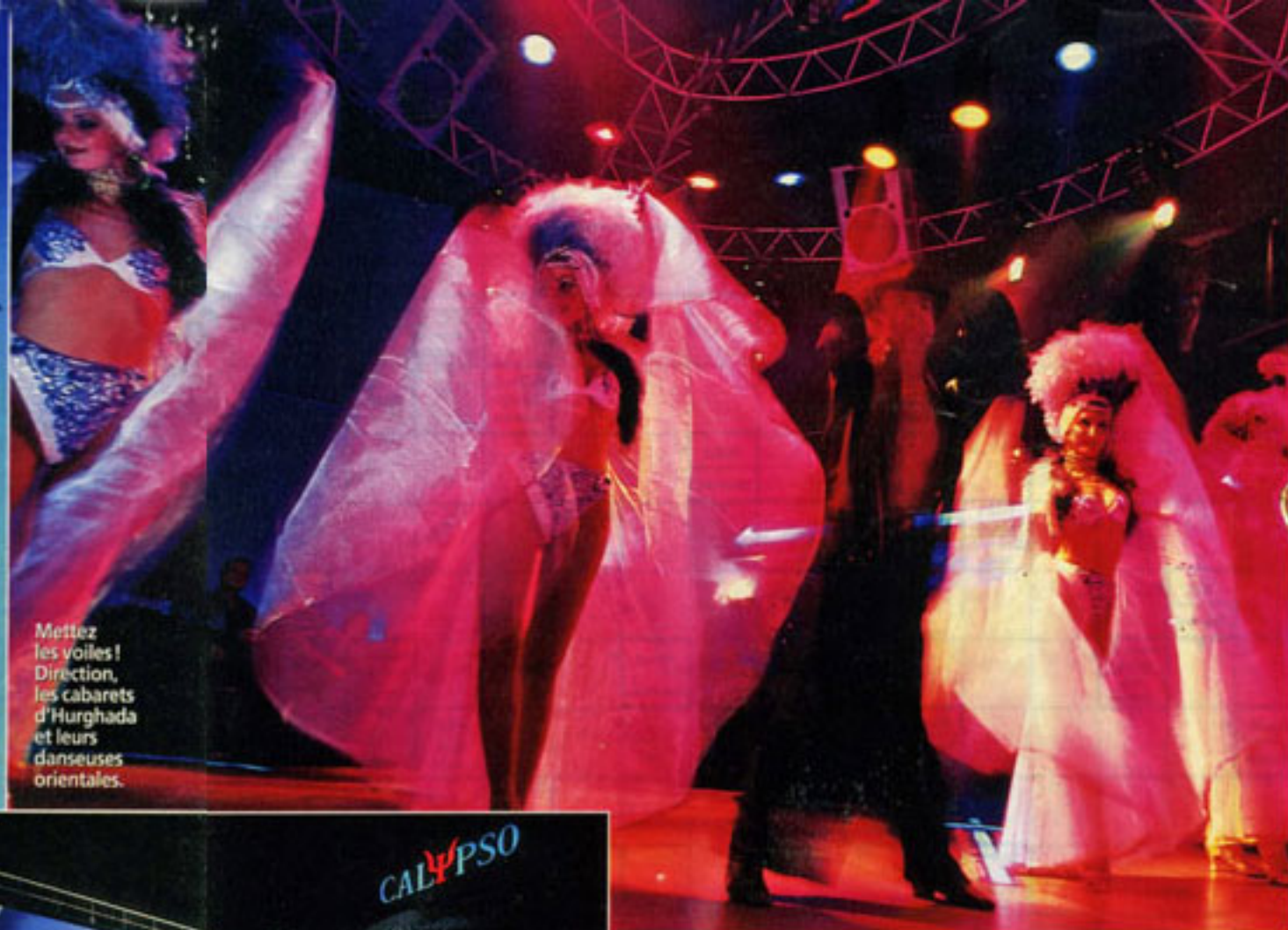
Mettez les voiles ! Direction, les cabarets d'Hurghada et leurs danseuses orientales.