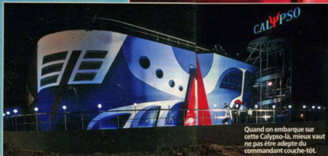
Quand on embarque sur cette Calypso-là, mieux vaut ne pas être adepte du commandant couche-tôt.