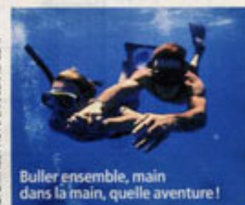
Buller ensemble, main dans la main, quelle aventure !

Le voyageur Cocorico (mais non, ce n'est pas une blague !) propose deux formules. Soit des forfaits séjours à Hurghada (plongées avec les dauphins en sus) à partir de