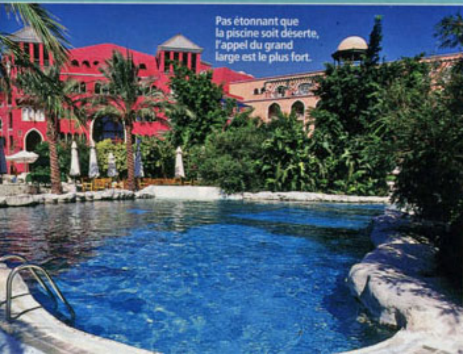
Pas étonnant que la piscine soit déserte, l'appel du grand large est le plus fort.